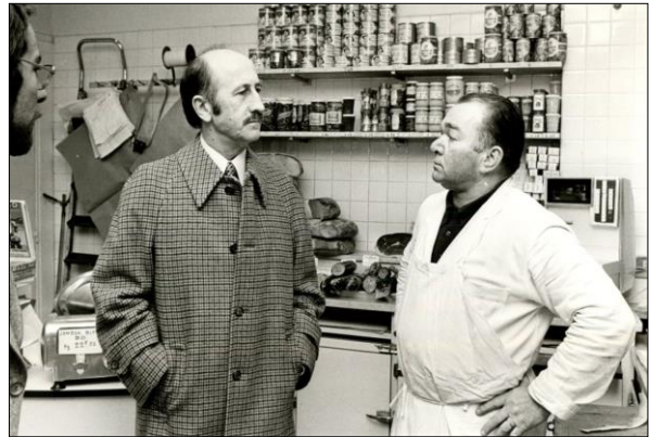
1975 : le ministre Vincent Ansquer sur le terrain, à une époque où, comme on le voit, le pastis était omniprésent, le jambon blanc vendu à 22,52 francs le kilo, et où le petit commerce ne pensait pas qu'il allait bientôt devoir céder la place aux grandes surfaces 1 .