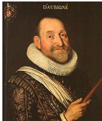
Agrippa d'Aubigné, portrait en 1622 (Bibliothèque Universitaire de Genève),

et le premier des onze volumes de son "Histoire Universelle" (1616-1630), 1 re édition, imprimée au fort Dognon près de Maillé, qu'il avait fait construire pour défendre Maillezais, une place protestante dont il était gouverneur.