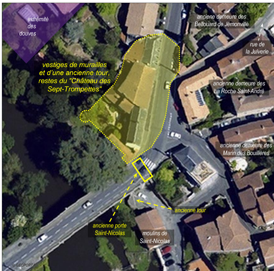
Localisation au XVIII e siècle du "Château des Sept Trompettes", chargé antérieurement de protéger les porte et pont Saint-Nicolas. (environ 120 x 120 m, © GEOPORTAIL)