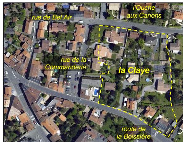
En bordure du "faubourg Saint-Jacques" : "la Claye", en 1814 et en 2009. (environ 240 x 190 m)